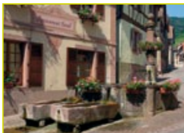
Fontaine, rue de l'église.