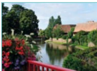
La Fecht vue depuis le pont.

réalisation www.atelier.com / photographies C. Dumoulin