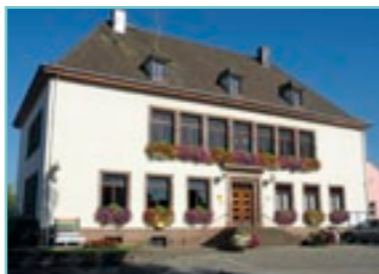
L'Hôtel de Ville d'Ostheim.