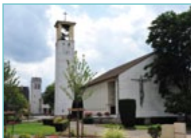
L'église protestante d'Ostheim.