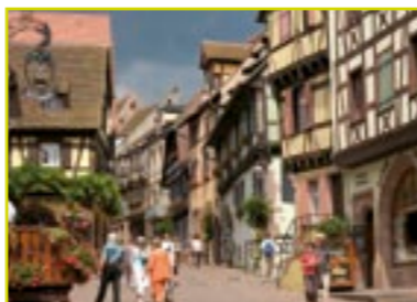
Rue du Général de Gaulle.