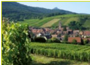
Riquewihr dans son écrin de vignes.