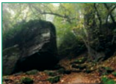
Massif du Taennchel.

réalisation www.ateliercc.com / photographies C. Dumoulin