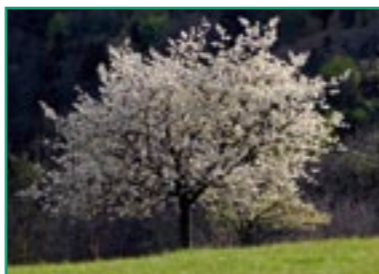
C'est le printemps ! Les cerisiers sont en fleurs...