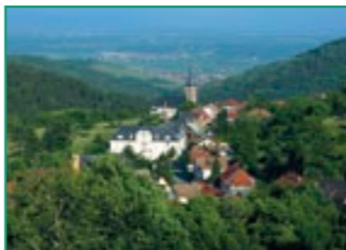
Vue sur le village et la plaine d'Alsace.