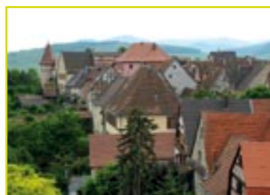
Vue sur le village et sa tour sud-est.