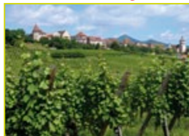
Zellenberg, vue depuis le vignoble.