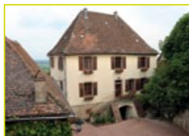
Mairie et presbytère.

réalisation www.atelier.com